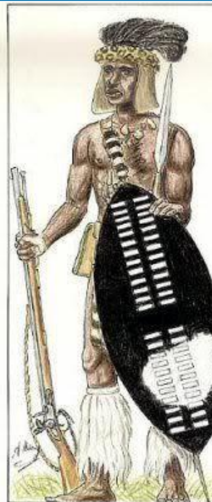
Set no.3 Anglo/Zulu War 1879 no.6 Isandhlwana - uMziyati Regt.