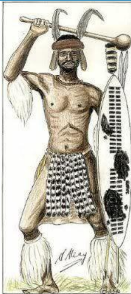
Set no.3 Anglo/Zulu War 1879 no.4 Isandhlwana - uMhlanga Regt.