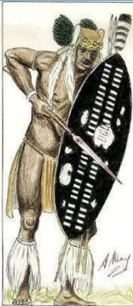
Set no.3 Anglo/Zulu War 1879 no.5 Isandhlwana - uVe Regt.